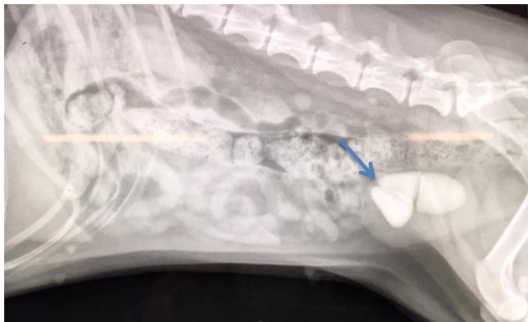
Figur 1: På røntgenbilledet, der hvor pilen peger, ses blæresten i blæren.

Bella fik efterfølgende taget et røntgenbillede af bughulen og nedenfor ses billedet, som viser at Bella havde tre store blæresten i blæren.